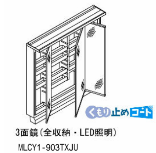
3面鏡(全収納・LED照明) MLCY1-903TXJU