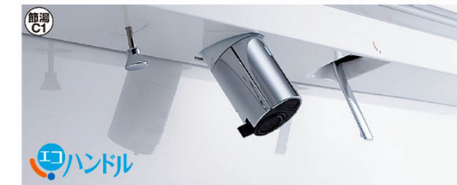
※写真は自動水栓タイプです。