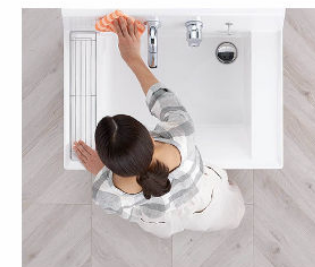
汚れにくくお掃除もカンタン