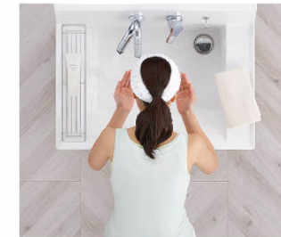
洗顔・洗髪もゆったりスペースで