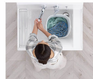
つけ置き洗い中も、バケツを避けての手洗いもOK