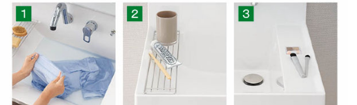
バケツの水汲みや衣類の洗い置きも、コップや泡立てネットなど、濡らしたくないものを、一つ置き洗いもしやすいです。濡れものを気兼ねなく置き置きするのにも便利です。