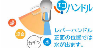
お湯が混合する位置はクリックでお知らせします。