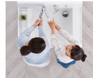
2人並んでの身支度もスムーズ