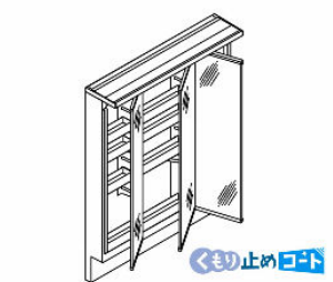
3面鏡 (全収納・スリムLED) MAR3-753TXJU